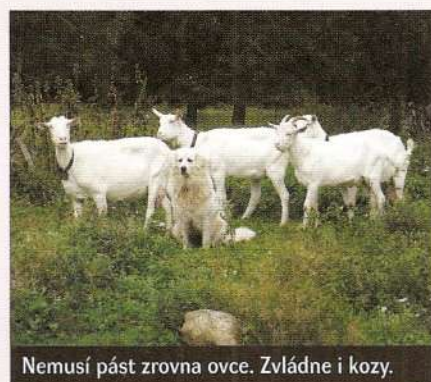
Nemusí pást zrovna ovce. Zvládne i kozy.

Barva je vždy bílá - a to i z důvodu původního uplatnění psa při hlídání stáda. Pes musel splýnout s ovci a musel být v noci rozeznatelný od šelem.