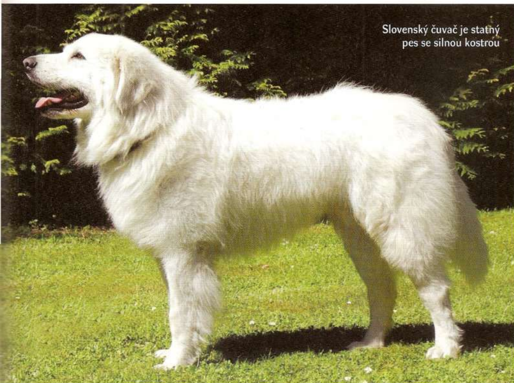
Slovenský čuvač je statný pes se silnou kostrou

Bezplatná linka: 800 108 999 WWW.ORLING.CZ