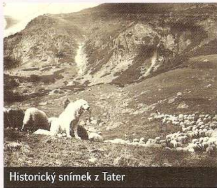
Historický snímek z Tater

výchovy je co možná největší fyzický kontakt nového majitele se štěnětem a co možná největší množství času, který nový majitel štěněti věnuje. Pro čuvače je přirozené žít ve smečce. Štěňátko bude smečkou právě jeho nová rodina, která mu musí dát možnost poznat ji, stát se její součástí a navázat se na ni. Je zcela nevhodné oddělit štěně od smečky tím, že ho na celý den vykážeme do kotce nebo na zahradu (úplně stačí, že v kotelci nebo na zahradě štěně v noci spí a tráví dobu, kdy je rodina v práci či ve škole). Naopak - je nezbytné nutné umožnit štěněti trvalý kontakt s jeho novou rodinou. Jen tak může vzniknout správný