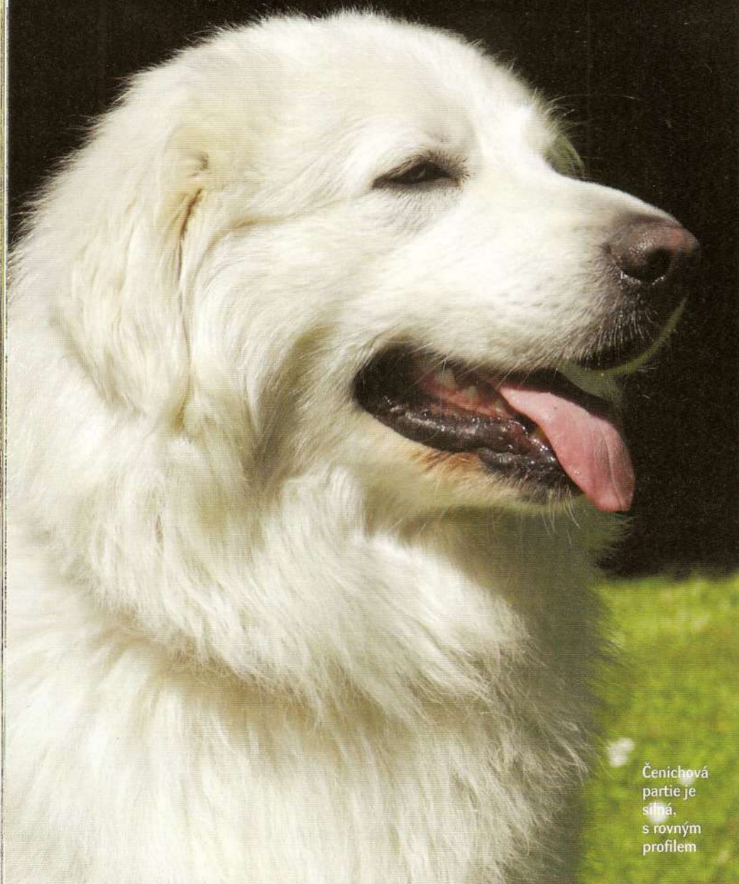
Čenichová partie je silná, s rovným profiem