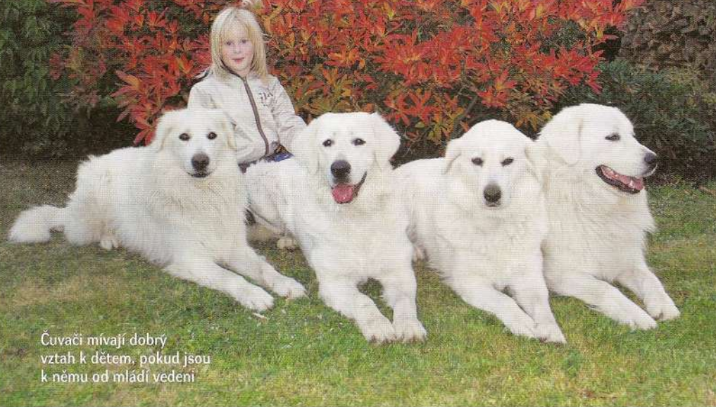
Čuvači mívají dobrý vztah k dětem, pokud jsou k němu od mládí vedeni

výchovy je co možná největší fyzický kontakt nového majitele se štěnětem a co možná největší množství času, který nový majitel štěněti věnuje. Pro čuvače je přirozené žít ve smečce. Štěňátko bude smečkou právě jeho nová rodina, která mu musí dát možnost poznat ji, stát se její součástí a navázat se na ni. Je zcela nevhodné oddělit štěně od smečky tím, že ho na celý den vykážeme do kotce nebo na zahradu (úplně stačí, že v kotelci nebo na zahradě štěně v noci spí a tráví dobu, kdy je rodina v práci či ve škole). Naopak - je nezbytné nutné umožnit štěněti trvalý kontakt s jeho novou rodinou. Jen tak může vzniknout správný