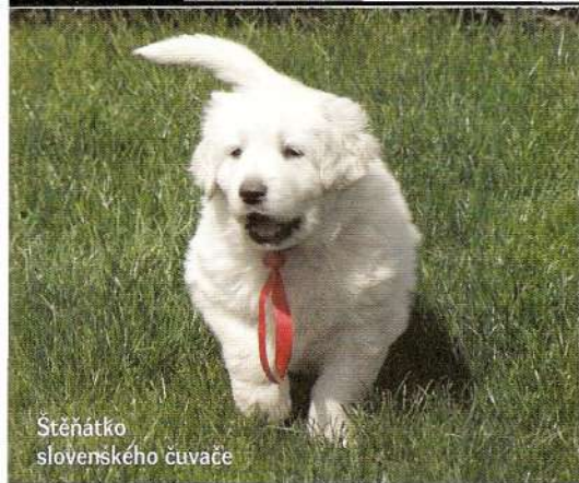
Štěňátko slovenského čuvače

Čuvač patří mezi velká plemena, psi mohou dosahovat kohoutkové výšky 70 cm a váhy 45 kg, proto je třeba hlavně štěňata a mladé psy nepřetěžovat. U rodičů se provádějí rentgeny kyčlí právě z důvodu minimalizace těžkého stupně DKK (dysplazie kyčelních kloubů) v populaci. Díky tomu se těžší formy dysplazie u psů s průkazem původu vyskytují pouze ojediněle. Jinými nemocemi čuvač netrpí, je to zdravé plemeno - a to i díky tomu, že se nikdy nestal vysloveně módní rasou. V řízené plemenitbě je možné použít v chovu jen zdravá zvířata. Pokud štěňátko a mladého psa budete kvalitně krmít a umožníte mu přiměřený pohyb, vyroste vám z něj krásný, hrdý představitel svého plemene, který bude mít jen minimum zdravotních problémů. Co se týká srsti, ta má úžasnou samočisticí schopnost. Sebešpinavější pes dokáže být během pár hodin zase sněhobílý. To ovšem neznamená, že čuvač nepotřebuje občas vyčesat, hlavně v období línání. Srst se provzdusní a odstraní se odumřelé chlupy.