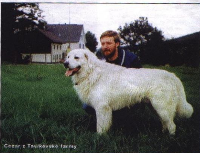
Cesar z Tavíkovske farmy

V tejto línií sa veľmi málo vyskytujú zvieratá hrubého konštitúčného typu, skôr sa vyskytnú jedince jemnejšej konštitúcie. Veľmi zriedka sa vyskytnú svetlé oko, prevažne sú oči hnedé až tmavohnedé. Vyskytujú sa nedostatky v nasadení a nesení uší a chvosta.