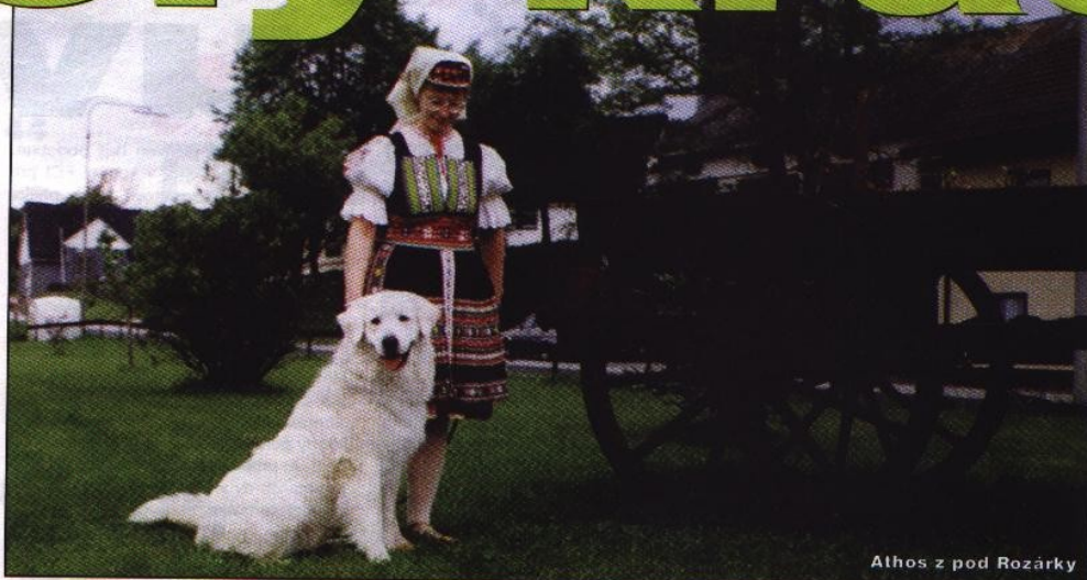
Althos z pod Rozárky

5. NERO - zakladateľ línie NERO z Liptovskej Lužnej pochádzal z pôvodného odchovu v Nízkych Tatrách. Do chovu bol zaradený ako trojročný a mal zlepšiť kvalitu srsti a pigmentu. Bol iba 63 cm vysoký, no i tak pomohol zlepšiť chov slovenského čuvača. Pokračovateľmi tejto línie boli cez Nerovho syna Úmeka z Turčianskej záhradky, jeho vnuci Dunaj z Pečenského jazera a Dunaj zo Schindlerovho dvora, cez ktorého pravnuke Edyho z Jizerské Chaloupky a Cézara z Kmochova rodiť by sa snáď v Čechách mohli nájsť ešte nejakí jedinici. Na Slovensku posledným pokračovateľom tejto línie bol NANO z Polinho dvora. Takže dnes táto línia už zrejme prakticky nejestvuje.