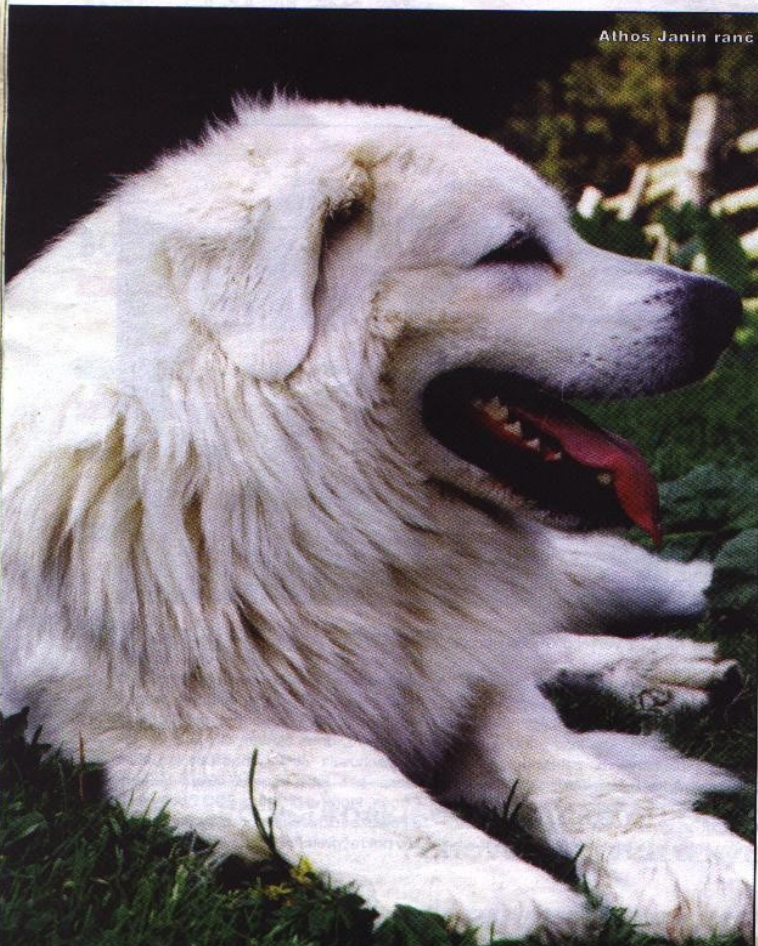
Althos Janin ranč

Lebka je silná, podlhovastá, v mozgovjej časti široká, čelo je zreteľné, široké, s plytkou úžlabinkou, ubiehajúce dozadu. Očnicové oblúky sú prímerné a na boky sklonené. Temeno hlavy je ploché, tylo zreteľné, s ostrým prechodom k silnému, mierne vyniknutému vázu. Profil temena je trochu vyklenutý nad rovinu chrbta núcháča.