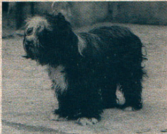
Na začátku dvou vývojových linií psů užívaných při pasení stád stojí noetseka doga (vlevo) a tibetský teriér. První má krátkou srst v obličejí a na koncových částech končetin, druhý má srst v obličejí i na končetinách (včetně koncových částí) dlouhou