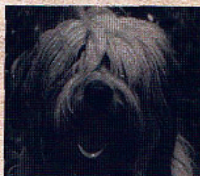
Evropskými představiteli ovčáků původu asijského jsou polský nížinný ovčák a staroanglický ovčák — bobtail (vpravo nahoru). Srovnaj typ osrstění s tibetským teriérem