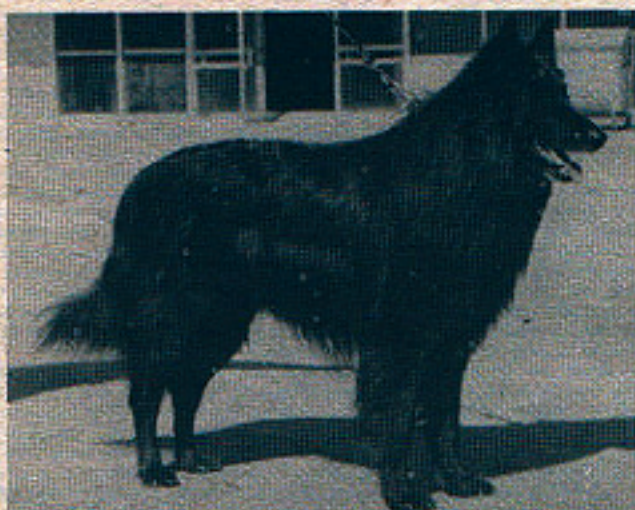
Kromě dvou linií psů asijského původu, které se druhotně rozšířily do Evropy, je zde ještě třetí skupina, ovčáci evropsí (v Evropě původní). Mají srst v obličejí a na koncových částech končetin krátkou a vztýčené ušní boltce. Na snímcích skotský ovčák — kolie (dole) a belgický ovčák groenendael (nahore)