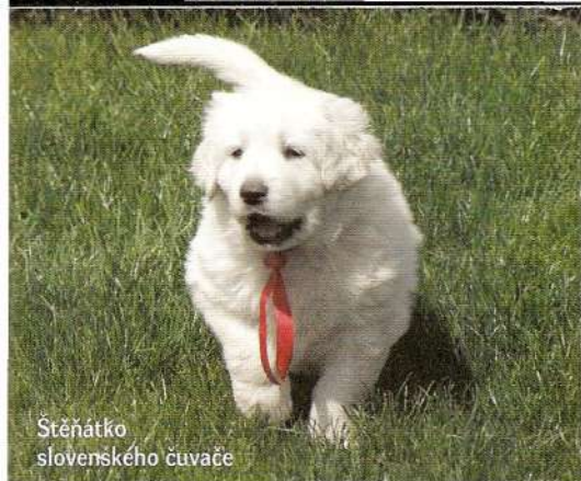
Štěňátko slovenského čuvače

Čuvač patří mezi velká plemena, psi mohou dosahovat kohoutkové výšky 70 cm a váhy 45 kg, proto je třeba hlavně štěňata a mladé psy nepřetěžovat. U rodičů se provádějí rentgeny kyčlí právě z důvodu minimalizace těžkého stupně DKK (dysplazie kyčelních kloubů) v populaci. Díky tomu se těžší formy dysplazie u psů s průkazem původu vyskytují pouze ojediněle. Jinými nemocemi čuvač netrpí, je to zdravé plemeno - a to i díky tomu, že se nikdy nestal vysloveně módní rasou. V řízené plemenitbě je možné použít v chovu jen zdravá zvířata. Pokud štěňátko a mladého psa budete kvalitně krmít a umožníte mu přiměřený pohyb, vyroste vám z něj krásný, hrdý představitel svého plemene, který bude mít jen minimum zdravotních problémů. Co se týká srsti, ta má úžasnou samočisticí schopnost. Sebešpinavější pes dokáže být během pár hodin zase sněhobílý. To ovšem neznamená, že čuvač nepotřebuje občas vyčesat, hlavně v období línání. Srst se provzdusní a odstraní se odumřelé chlupy.