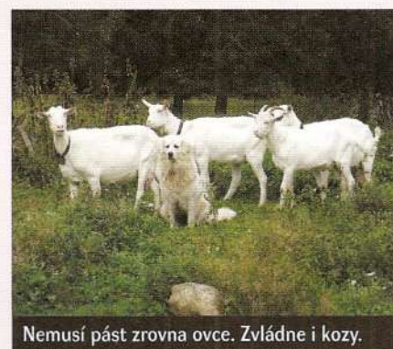
Nemusí pást zrovna ovce. Zvládne i kozy.

Barva je vždy bílá - a to i z důvodu původního uplatnění psa při hlídání stáda. Pes musel splýnout s ovci a musel být v noci rozeznatelný od šelem.